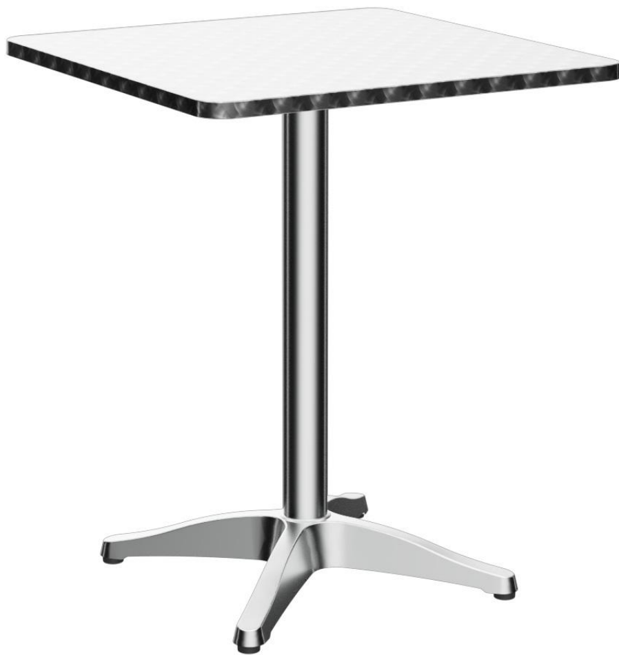
TABLE À MANGER HELLI T