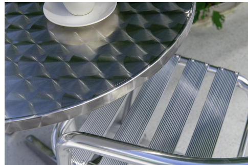
TABLE À MANGER HELLI T