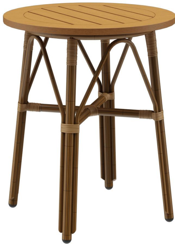
TABLE À MANGER MARYSOL