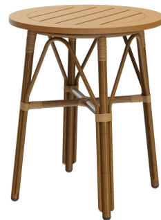
TABLE À MANGER MARYSOL