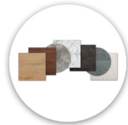
Große Auswahl an Tischplatten / Large selection of table tops / Grand choix de plateaux de table