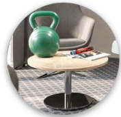
DIN EN 15372 Geprüfte Standsicherheit / Tested stability / Stabilité testée