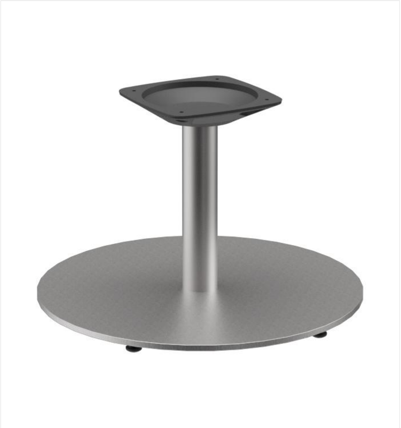
TABLE BASSE KERST SLIM