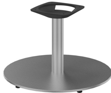
TABLE BASSE KERST SLIM