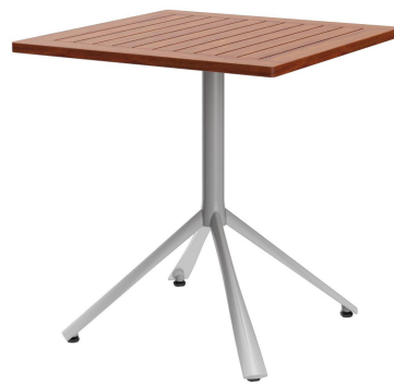
TABLE À MANGER KARI