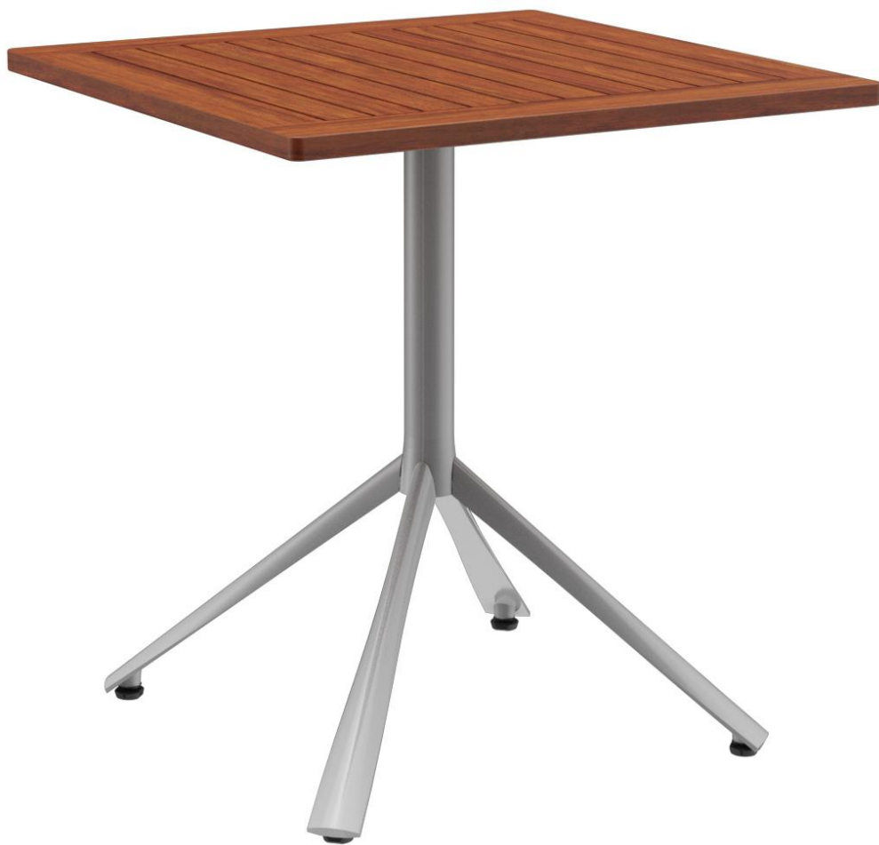
TABLE À MANGER KARI