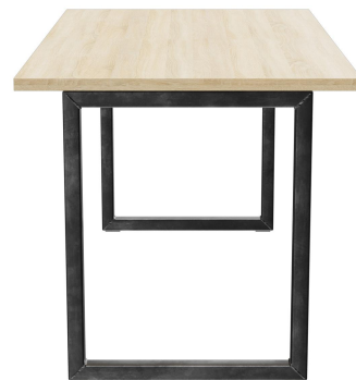
TABLE À MANGER RICKON