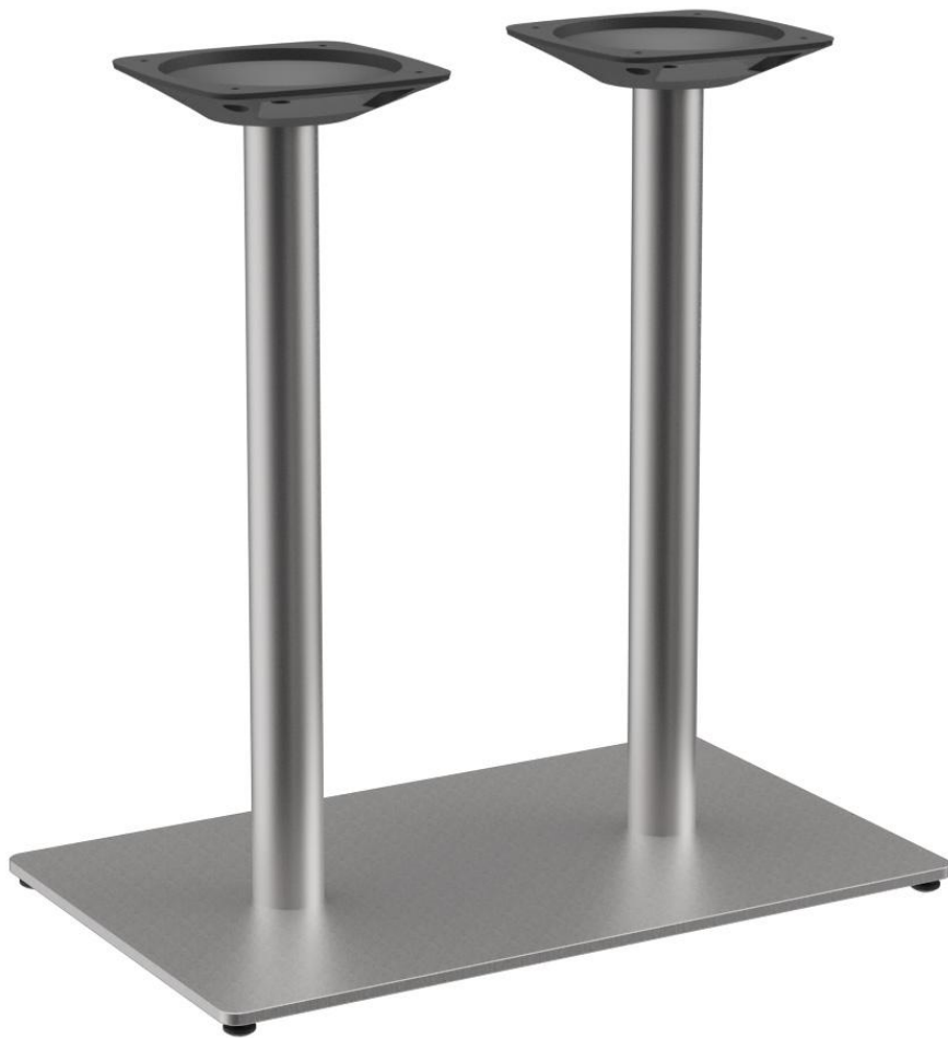
TABLE À MANGER KERST SLIM